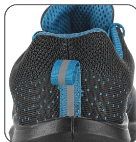
reflexní doplňky reflective accessories elementy odblaskowe