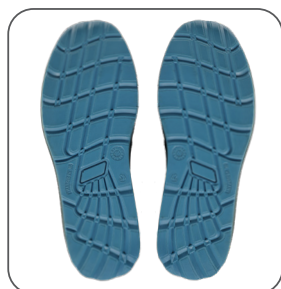
podešev outsole podeszwa