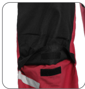
zesílena kolena s možností vložení výztuh reinforced knees with possibility to insert pads kolana wzmacnione z możliwością włożenia nakolanników