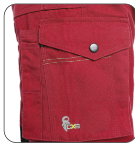
multifunkční kapsy na boku multifunctional side pockets boczne kieszenie wielofunkcyjne